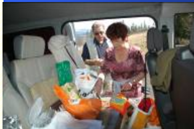
VERECKÉN - TERÜLJ, TERÜLJ ASSZONYKÁM ...