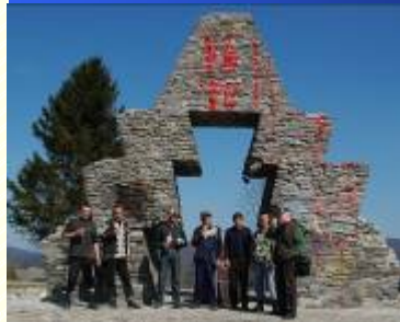
VERECKEI EMLÉKMŰ / 2009. ÁPRILIS 5.-ÉN / - NINCS MIT MONDANOM !