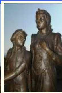
II. RÁKÓCZI F. - ZRÍNYI I.