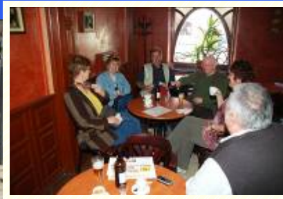
SÖR - VODKA - KÁVÉ