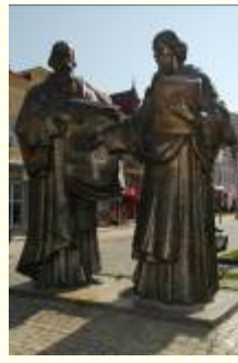
CIRIL - METÓD